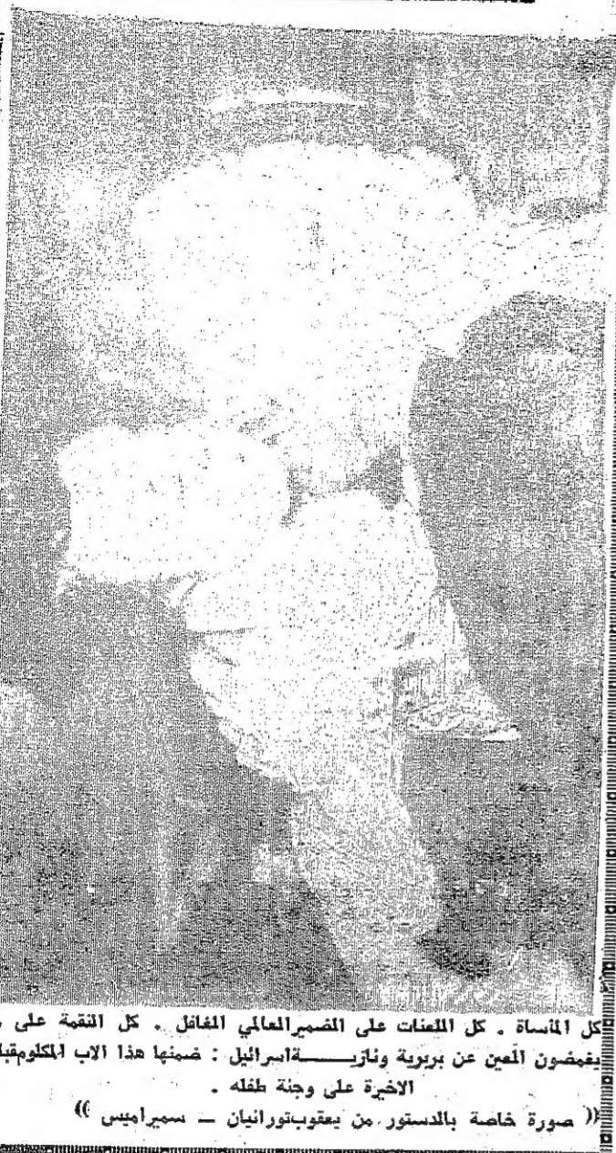
بعض ضحايا الجريمة الإسرائيلية البشعة: نساء واطفال وشيوخ فاجاهم العدوان الامم وهم نائمون آمنون نسي مخازهم